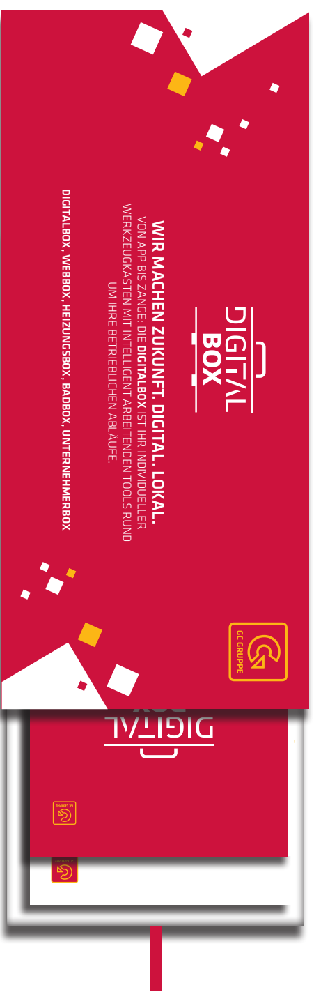
Draufsicht der Verpackung