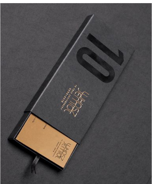
Verarbeitung und Visualisierung der Verpackung